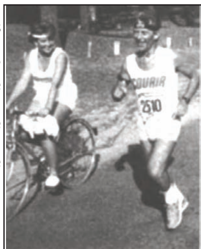
La joie d'être accompagné de sa fille

Madame la Vie ne fait pas souvent de cadeaux. Le début de mon existence fut difficile, fort heureusement, j'ai rencontré des hommes merveilleux, des éducateurs à l'ASPTT de Paris, mais je la termine également très difficilement puisque je suis devenu aveugle. Certains diront : c'est le destin. Pourquoi pas ? Donc, mes amis, je vous dis « au revoir », mais ce n'est pas un « adieu », j'espère avoir encore l'occasion d'écrire d'autres textes, sait-on jamais ?