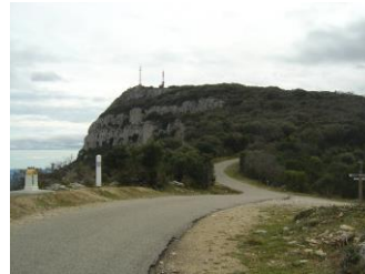
Guidon du Bouquet