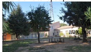
de l'Hort à Anduze, aux bords du Gardon

En complément aux efforts physiques, nous avons retenu un site repos pour revitaliser notre corps.