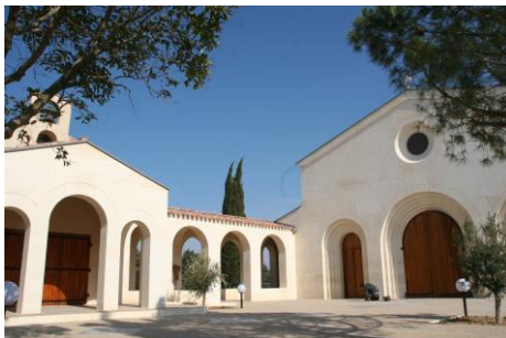
Abbatiale St Joseph Mont Rouge Puimisson