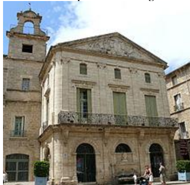
Maison Consulaire de Pézenas