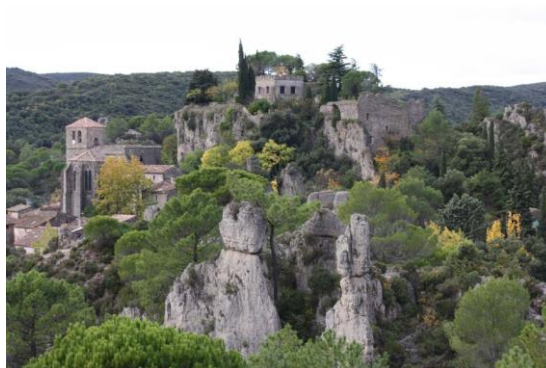
Cathédrale et cirque de Mourèze

Nota : circuits à la journée selon demande !