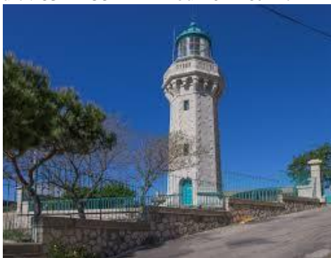
Phare du Mont st Clair à Sète