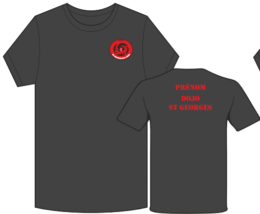
T-SHIRT 100% Coton

🔥 Lavage à 30° max. 🚫 Pas de sèche-linge. 🧺 Repassage à l'envers.