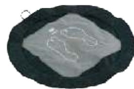
TAPIS DE DOUCHE 13€