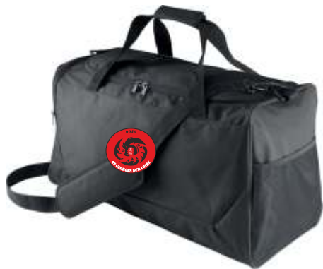
SAC 46 LITRES 22€