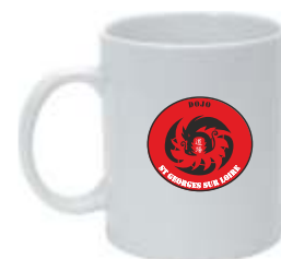
MUG Taille Unique 5€