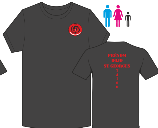
T-SHIRT TAISO 100% Polyester