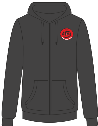
VESTE ZIPPÉE 80% Coton 20% Polyester