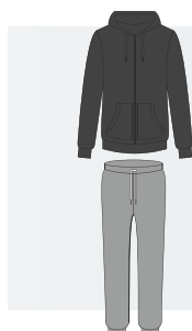
PACK 1 Pant. léger + Veste zippée