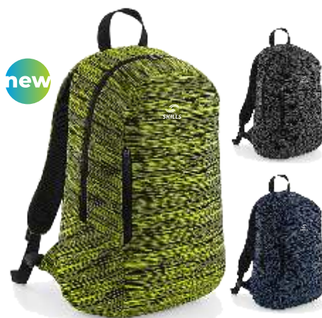
Sac à dos Skills

100% Polyester. 20 litres. 31 x 50 x 16 cm.