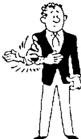
TOKETA (Fin d'immobilisation)