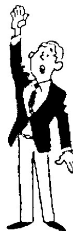
IPPON Un point (valeur 10 points)