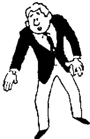
OSAEKOMI (Début d'immobilisation)