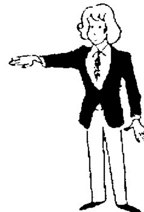
WAZA-ARI Un demi-point (valeur 7 points)