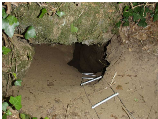
Illustration 7: Après les travaux de Michel. Là, je passe!