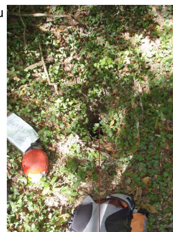
Illustration 11: Doline D-Genis-Mouq-X400830. Suite possible

Aucune suite n'est visible dans ces dolines.