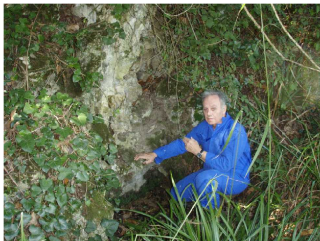
Illustration 3: