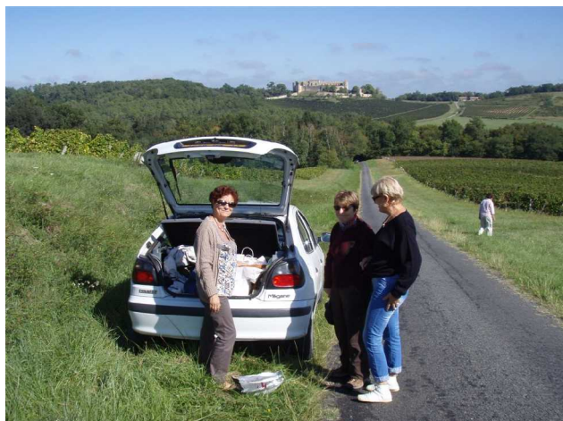
Illustration 2: Les prospecteurs se préparent

Nous sommes sur le site de la Benauge vers 11h