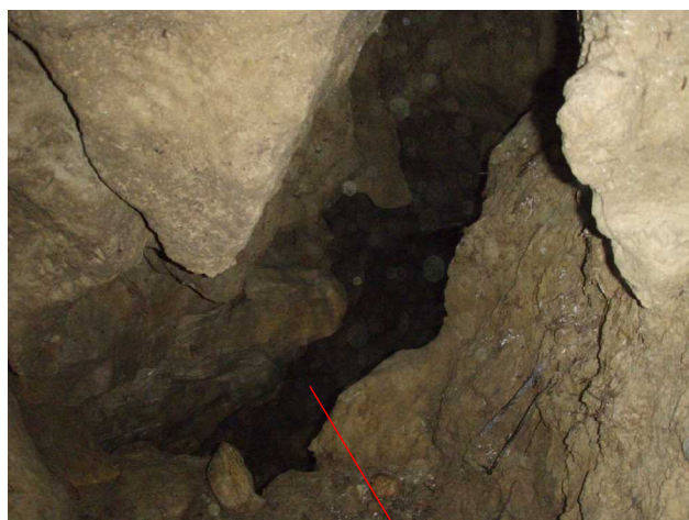
Illustration 8: Le Trou Noir et la suite qui donne sur le réseau. La hauteur est de 2mètres