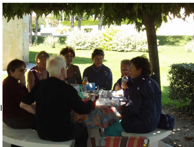
Illustration 4: Le pique nique à Arbis