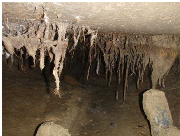
Illustration 9: Les rastas

En surface Michel doit s'impatienter. Cela fait 40 minutes que j'ai disparu de la surface.