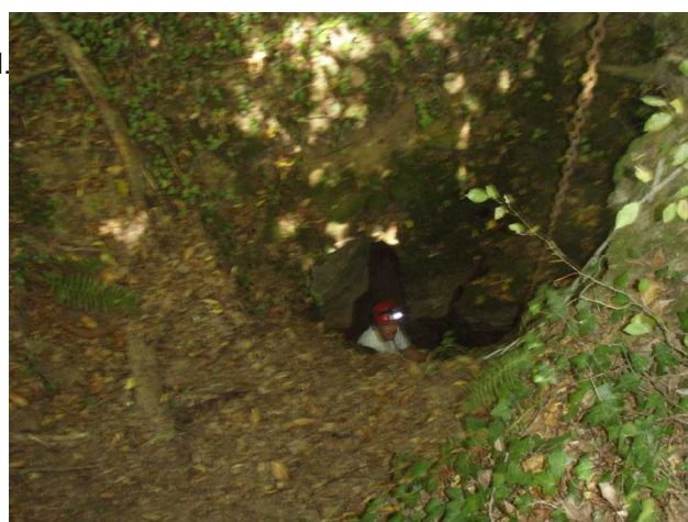
Illustration 5: Au fond de la Mouqueterie Aval