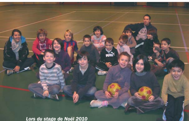
Lors du stage de Noël 2010

Pour renseignements et inscriptions, voir coordonnées ci-dessus.